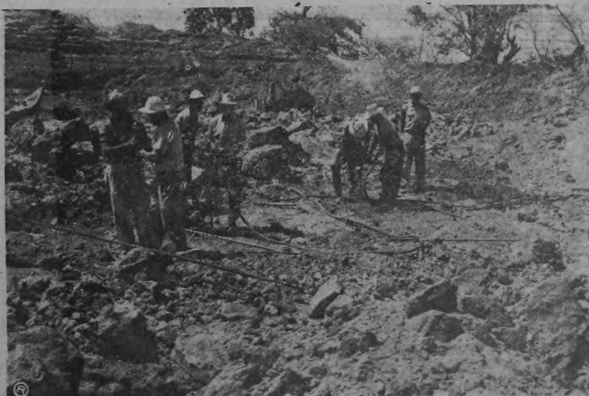
En el sector sur de la represa de la Planta de El Electrón la Cía. de Fuerza y Luz S. A., tumba un cerro de 50.000 yardas cúbicas para instalar una planta térmica con un costo de 25 millones de colones y que generará 10.000 KW. Las fotografías muestran varios aspectos de la excavación. Información página 16.