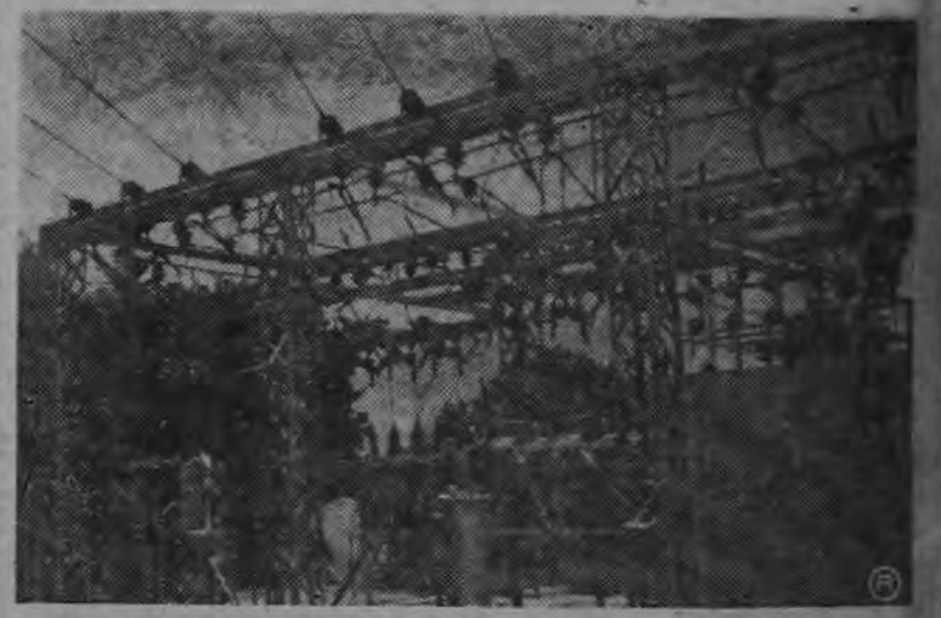
La Sub-estación de El Electriona, la que, después de ser reforzada, se encargará de la distribución de la fuerza que genere la planta térmica que quemará aceite crudo y que producirá energía por medio de vapor.

¿Nos irá a pasar hoy lo que le ha pasado a esta Rica siempre? El Poder Ejecutivo, La Asamblea Legislativa, el Servicio Nacional de Electricidad, el Instituto Costarricense de Electricidad, y aún la propia Compañía de Fuerza y Luz, tienen que cumplir con su deber. De lo contrario estarán llevando el país a una situación que bien puede estallar en cualquier momento, ya que la indignación del público ya en aumento cada día. No se puede jugar mucho tiempo con la paciencia de los costarricenses. Nosotros apelamos a los organismos y funcionarios del Estado para que mediten bien los pasos que han de dar con respecto al futuro eléctrico nacional. No deben haber vacilaciones de ninguna especie. Lo primero debe ser Costa Rica, lo demás es secundario. Si hay que nacionalizar, nacionalicemos, pero son titubeos. Lo trascendental es que los costarricenses todos tengan suficiente energía eléctrica.