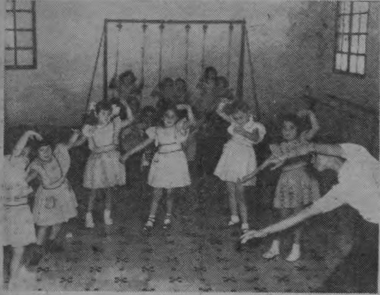
Ejercicios de demostración rítmica ejecutados por un gracioso conjunto de pequeñas alumnas del Kinder "Arturo Urien", que hoy tomarán parte en la concentración de la Asociación de Educación Pre-Escolar, que se llevará a cabo en la Escuela García Flamenco.

Leche, Crema, Mantequilla, Fresas, Sodas, Malteadas, Eskimo Pie, Pops, etc., y HELADOS AMERICANOS